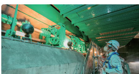
勝開橋を開閉していた動力部分