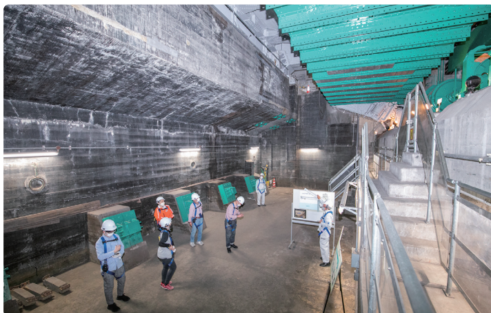
橋脚の中には巨大な空間が広がっています。