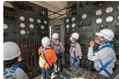
機械類が並んだ運転室を見学!