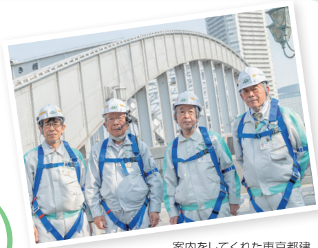
案内をしてくれた東京都建設防災ボランティア協会の皆さん

橋脚内見学ツアーは、東洋一といわれた高度な技術的工夫がこらされた開閉の仕組みを多くの方々に知っていただくために開催しています。