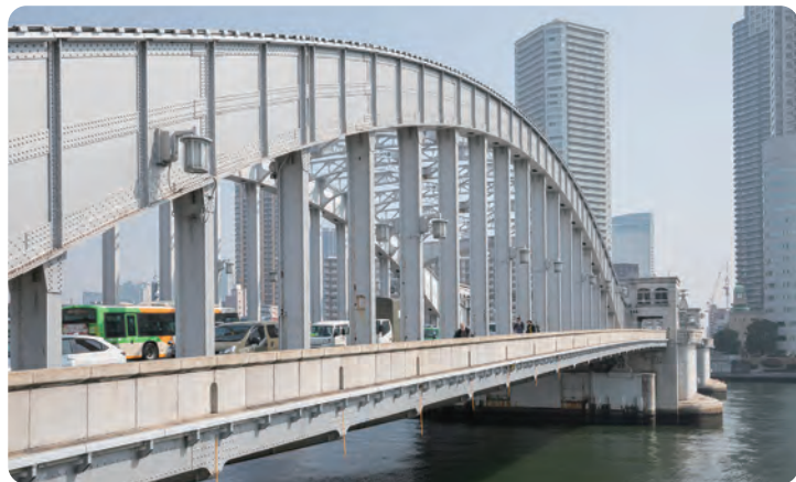
勝開橋は、昭和15年(1940年)に隅田川河口部に築造された、わが国で最大規模を誇る可動橋です。橋の中央部を「ハ」の字型に開いて、1000トン級の大型船舶を通すことができました。