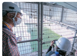
橋脚の中から隅田川を見ることが出来ます。