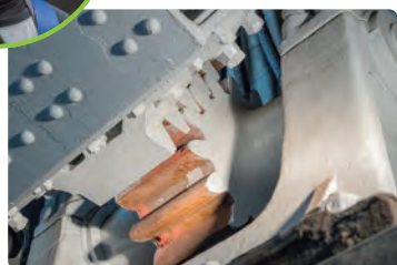
間近で見る歯車の大きさにびっくり!