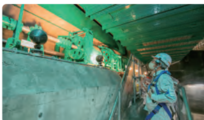
勝開橋を開閉していた動力部分