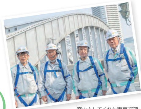
案内をしてくれた東京都建設防災ボランティア協会の皆さん

橋脚内見学ツアーは、東洋一といわれた高度な技術的工夫がこらされた開閉の仕組みを多くの方々に知っていただくために開催しています。 このツアーは、東京都建設防災ボランティア協会が解説しながら橋脚内を案内します。